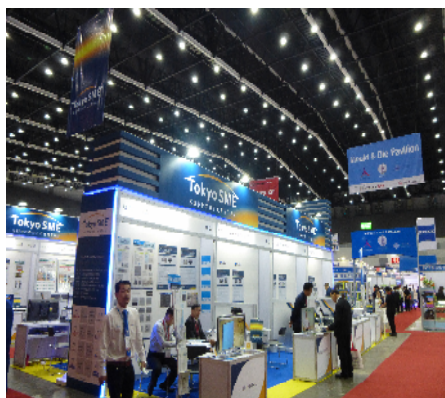
(公社企業支援ブース)