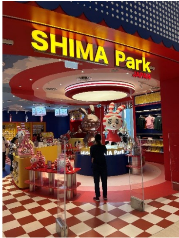
<しまむらのコンセプトショップ>

ター「しまうさ」を前面に押し出したポップなデザインで、日本で見るとは異なるタイならではの雰囲気となっています。こうしたところにも、キャラクターは“撮影消費”を促す重要なコンテンツとなっていることが感じられます。