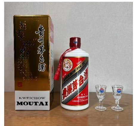
アイコニックな茅台飛天

市場の大きさから経済界での存在感も無視できません。数ある白酒ブランドの中で最も有名なのが貴州茅台（マオタイ）で、当社の時価総額は中国A株市場において長年にわたりトップクラスに位置しています。また、その主力銘柄である飛天（写真）の市場価格は白酒業界の景況感を示すベンチマークとして使用されています。