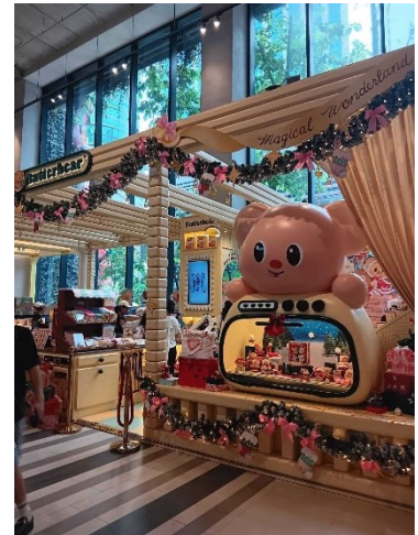
<バンコク都内バターベアの店舗>

近年人気のタイ発祥のキャラクターとして「Butterbear（バターベア）」があります。名前のとおり、クマをモチーフにしたキャラクターでシンプルな表情と淡い色使いが特徴的です。2024年にバンコク中心部のモールに実店舗をオープンした頃から特に人気に火が付き、SNSを中心に若年層へ急速に広がりました。ベーカリー・スイーツショップのブランドとしてスタートしましたが、店舗ではステッカーやアパレルなどのキャラクターが使用された幅広い関連する商品が展開され、購入しやすい低価格アイテムが多いことも支持を後押ししています。キャラクター×スイーツ/ベーカリー×体験型消費という、SNS映えや体験に基づく消費トレンドにマッチしたことが人気の背景にあると言われています。