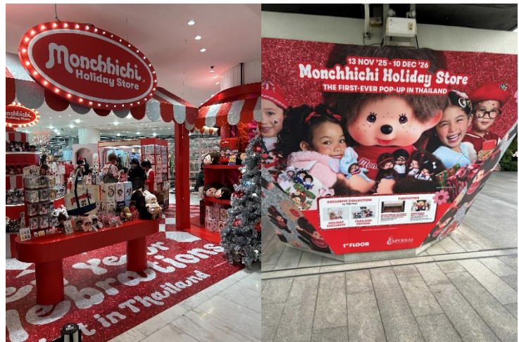
<プロンポン駅周辺の EM District を飾るモンチッチ>