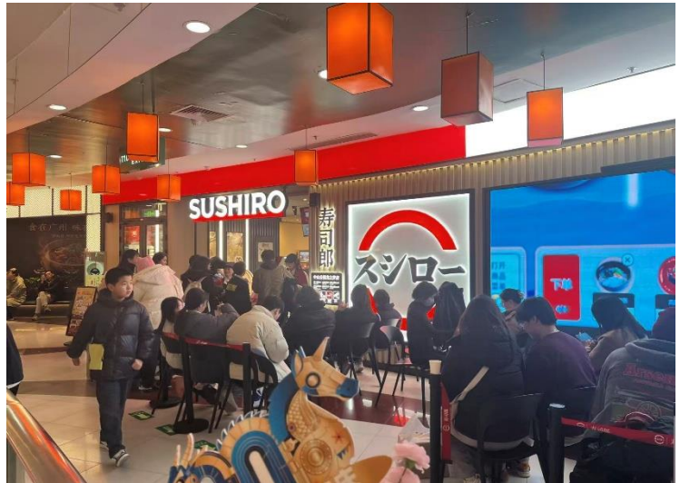
<上海で開店以来連日賑わいを見せるスシロー>

スシローは2021年広州での出店を皮切りに、華南から内陸、華北地域へと出店を広げ、2024年末に華東地域では初となる蘇州での出店を経て、2025年12月に上海出店を果たしました。価格帯は現地ローカル飲食店と比較すると決して安価ではありませんが、それにもかかわらず若年層からファミリー層まで幅広い客層を取り込んでいます。背景には、①食材の安全性、②味やサービスの安定感、③清潔感のある店舗設計、④デジタル注文などによる利便性といった、日本ブランドが長年培ってきた強みがあります。