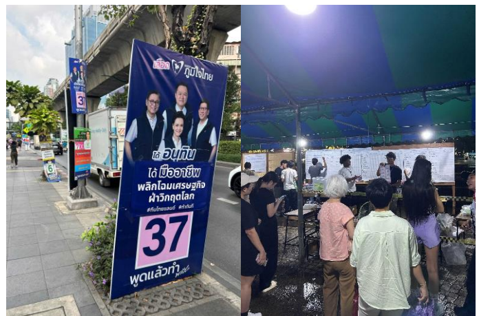
＜選挙ポスターと投票所で開票の様子を見守る人々＞

選挙期間中の秩序維持や冷静な判断を促す目的とされ、コンビニやスーパーなどの小売店に加えて、飲食店やホテルでも販売が禁止されます。限られた期間ではありますが、タイ国民だけでなく、観光客を含む外国人もアルコール飲料が購入できません。タイでは近年の選挙で投票率が70%台半ばと比較的高い水準で推移していますが、こうした取り組みがその一助になっているのかもしれませんが、